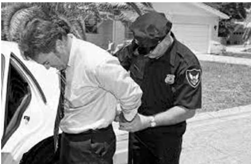
Délinquant à col blanc dans la vie, serviteur de DIEU zélé et dévoué dans les faire-part

une vie contraire à la volonté de Dieu ( ivrognerie, prostitution, corruption, violence... ) et sont décédés des suites de cette vie impie ( MST, SIDA, cirrhose du foie... ). Ces personnes ne peuvent donc pas comme