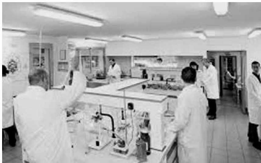
Un laboratoire de recherches scientifiques

Un autre procédé très à la mode de nos jours est d'aller dans ce que certains appellent « la salle d'attente de l'immorta-