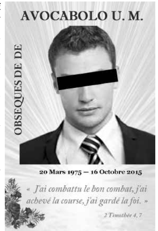
Un exemple de «faire-part»

Cher lecteur, la mort est une réalité et c'est d'ailleurs le chemin de toute