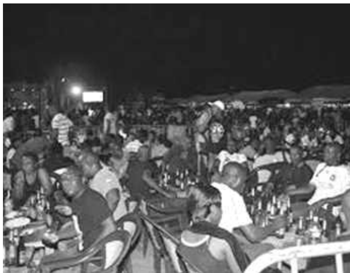
Les jeunes, lors d'une veillée, s'en donnent à cœur joie

Certains responsables religieux invités aux obsèques n'échappent pas à cet esprit de cupidité. De fait, leur présence ici est conditionnée par le versement préalable d'une coquette somme d'argent, somme qu'ils complètent d'ailleurs par les deniers du culte collectés à plusieurs reprises lors de l'office religieux. Tout ceci pour tirer profit du monde et du portefeuille des personnalités parfois présentes. Ces responsables religieux sont prêts à « envoyer », comme ils le disent, le défunt au ciel, malgré la Parole de DIEU dans Hébreux 9 : 27 , lorsque leurs poches ont été bien remplies d'argent. Alors que les vrais serviteurs de DIEU observent plutôt cette prescription de CHRIST : « Vous avez reçu gratuitement, donnez gratuitement » ( Matthieu 10 : 8b ).