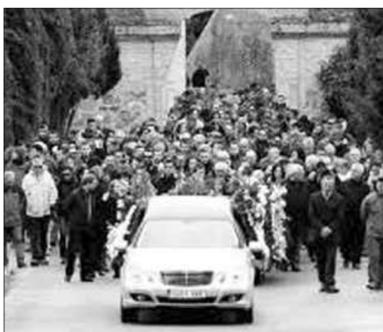
Le dernier voyage