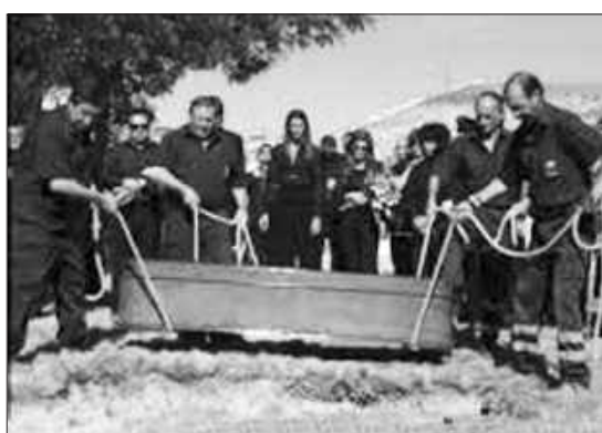
Tu es poussière, et tu retourneras dans la poussière.