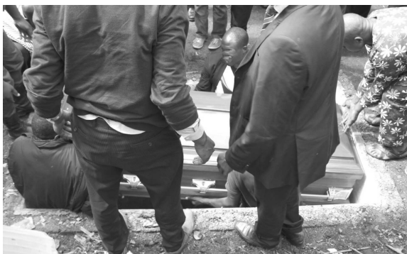
Tu es poussière et tu retourneras dans la poussière

N'es-tu pas prêt à rejoindre les sectes pernicieuses, à pratiquer la magie, à voler les fonds publics, parce que tu veux toujours rouler dans les grosses cylindrées ou vivre dans un confort extravagant pour entretenir ton orgueil au détriment de ton âme ? Cependant il est écrit : « Et que servirait-il à un homme de gagner tout le monde, s'il perdait son âme? ou, que donnerait un homme en échange de son âme? » ( Matthieu 16,26 ). Tu n'emporteras rien de toutes ces choses lorsque tu retourneras dans la poussière. Mais si tu les obtiens dans la droiture, tu auras néanmoins la conscience tranquille sur leur origine durant ton séjour sur la terre.