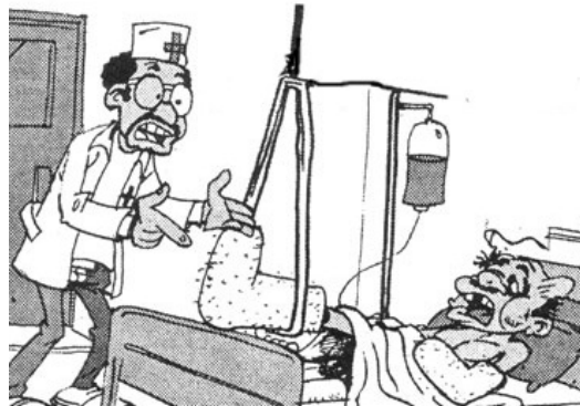
Ainsi étendu, l'homme est ramené à sa vraie dimension

ont la possibilité financière pour se défendre. Le Seigneur JESUS-CHRIST à ce sujet instruit les hommes à travers la parabole de l'homme riche qui, voyant l'abondance de sa récolte, formula des projets sans toutefois penser à DIEU. Malheureusement, la même nuit, son âme lui fut redemandée, car comme le dit Luc 12 :21 , « Il en est