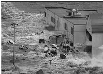
A l'instar du déluge, les catastrophes sont la conséquence du mépris de la gloire de DIEU