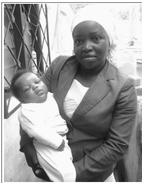
Healthy diet for the neonate and the nursing mother

Nursing women need more proteins. Lean meats, poultry, pork, fish, eggs, dairy products, nuts, seeds and legumes supply the most protein to your diet. During pregnancy and delivery, many tissues are over used and some worn out. Proteins