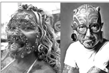
Orgueilleux, l'Homme prétend corriger l'oeuvre parfaite de DIEU, au péril de sa vie !

Lire notre dossier spécial de la page 5 à 11