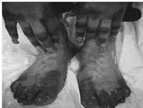
Les conséquences néfastes du décapage de la peau

Par leur sagesse qui n'est que folie devant DIEU ( Romains 1 : 22 ), certains changent la couleur de leur peau par des produits qu'ils appliquent sur leur corps ou injectent dans leur organisme. D'autres changent volontairement la forme de certaines parties de leur corps au moyen de la chirurgie (changement des lèvres, du nez, la pose des prothèses mammaire et fessière, liftings...). D'autres ne sont pas fiers d'être homme ou femme et choisissent de changer leur morphologie aux moyens de la chirurgie et des hormones. Les sourcils et les cils que DIEU a placés sur le visage des femmes ne sont pas du tout appréciés par certaines ; c'est pourquoi, elles n'ont aucune gêne à enlever totalement les sourcils et à les remplacer par un trait de crayon, ou à ajuster leurs cils pour qu'ils deviennent très longs. Voyant que les ongles qu'elles ont ne leur