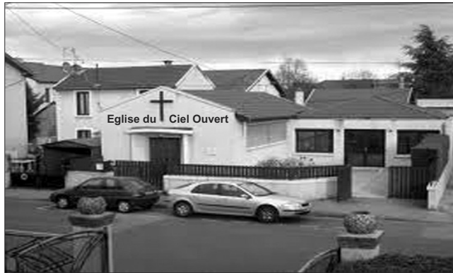
La dénomination pompeuse d'un lieu de culte n'implique pas la présence de DIEU

JESUS. Il se retourna, et leur dit : Si quelqu'un vient à moi, et s'il ne hait pas son père, sa mère, sa femme, ses enfants, ses frères et ses sœurs, et même sa propre vie, il ne peut être mon disciple. Et quiconque ne porte pas sa croix, et ne me suit pas, ne peut être mon disciple » (Luc 14 : 25-27).